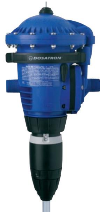
Пропорційний дозуючий насос